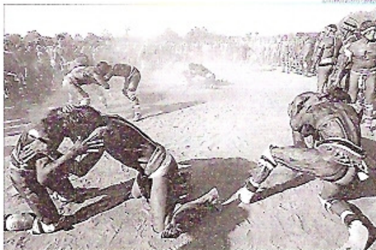
La tribu de la región amazónica de Xingú (Brasil) practicando la llamada lucha Huka Huka

El segundo de los trabajos que el expedicionario presentó a los alumnos del IES El Palmero era que el que más expectación levantó, pues se trata del último proyecto que ha realizado este apa-