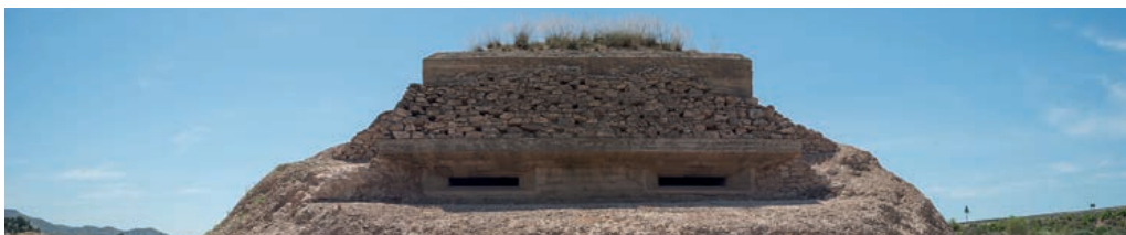
Búnker de Casas de Guirao. Alhama de Murcia. Estado final.