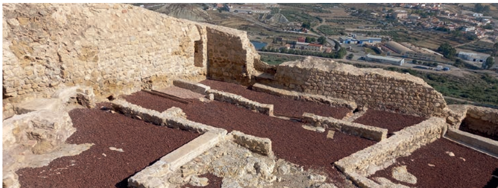
Parque Arqueológico del Castillo de Lorca, tras la intervención (Lorca).

VUELTA EN AUTOBÚS A CARTAGENA CON PARADA EN MURCIA (PLAZA DE LA OPINIÓN), SOBRE LAS 20:15 H.