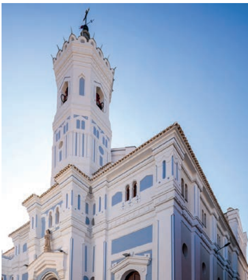
Fotografía de la fachada principal de la iglesia del Niño Jesús de Yecla tras los trabajos de restauración.