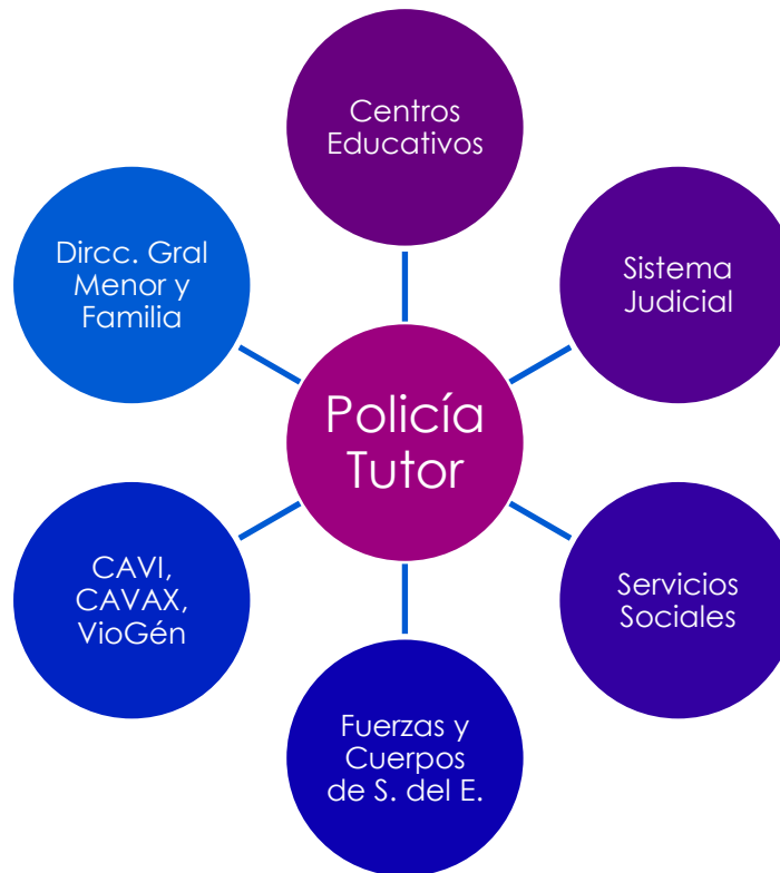
Gráfico 1: Trabajo en red entre las distintas instituciones implicadas.

Se trata de una organización laboral en red donde se trabaja en equipo y en estrecha coordinación entre todas las personas implicadas y especializadas en la protección de menores y familias: