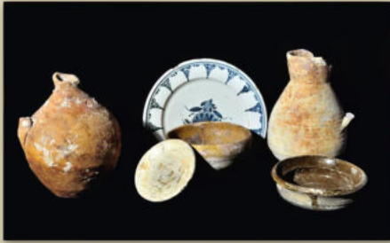
Museo Arqueológico Municipal. Escapar Escudero de Castro (Cartagena). Cerámica y vajilla S.MII

La expulsión se dio por finalizada por Cédula del Consejo Supremo del 5 de agosto de 1614. Muchos de los moriscos “antiguos” o “mudéjares” del Reino de Murcia la habían evitado ocultándose, huyendo o haciéndose pasar por cristianos viejos; partieron al exilio unos 2.500. Algunos regresaron clandestinamente en los años siguientes, con la complicidad de los vecinos, pero justicias y comisionados los prendían y castigaban a azotes y galeras por lo que la expulsión no concluyó hasta 1626, cuando Felipe IV ordenó que no se procediese más contra ellos.