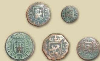
Museo Arqueológico de Murcia. Maravedíes de Felipe III, 1604