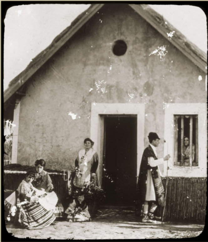
Fundación Vicente Medina.