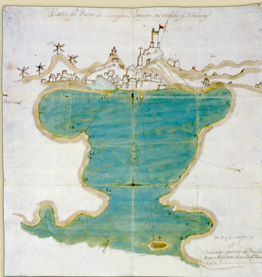
Planta del puerto de Cartagena. 1607 (MS. M.P. y B. 10313-54)

El puerto de Cartagena conoce en las dos primeras décadas del siglo XVII su apogeo comercial. Además continúa el movimiento militar con la visita de las escuadras de galeras y otras armadas, así como la actividad corsaria local, mitad militar y mitad económica.