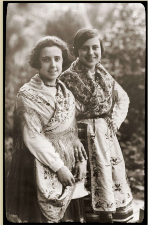
Fundación Vicente Medina.

Todavía a finales del siglo XIX podía escribir el poeta de Archena Vicente Medina: