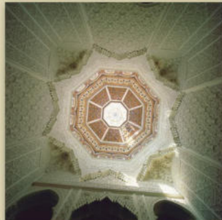
Capela Balneario de Archena. José Luis Mateos