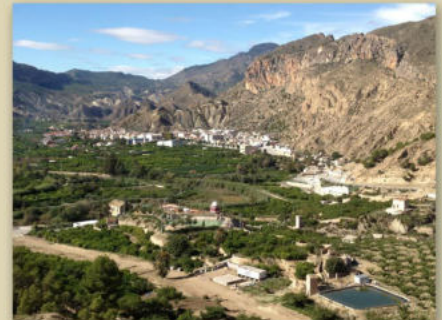
Panorámica de Ulea. Ayuntamiento de Ulea