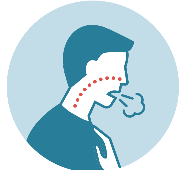
Sensación de falta de aire