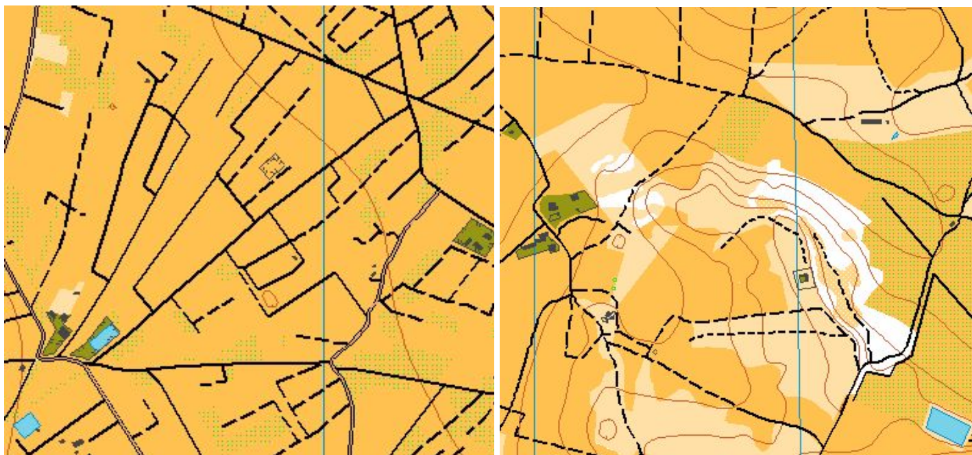
Ejemplo de dos zonas del mapa

El mapa está situado en la margen derecha del río Guadalentín, una zona llana con una abundante red de caminos y con poco desnivel. El mapa está dividido en dos por la autovía de Alhama al Condado de Alhama, solo se podrá cruzar la autovía por los puntos habilitados por la organización . En la parte oeste el cauce del río Guadalentín se podrá cruzar por determinados puntos que deberán determinar los corredores. La vía verde del campo de Cartagena cruza el mapa por la parte sur.