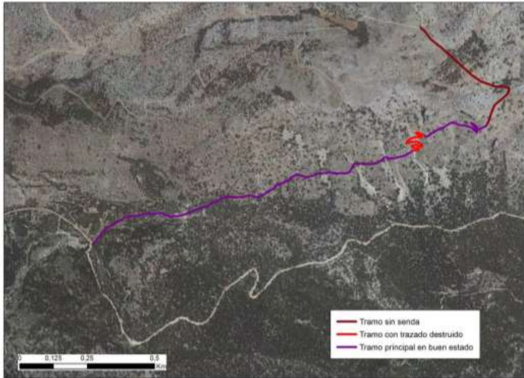
Figura 2. Localización de la zona de acceso restringido temporalmente en el área del Pedro López. Se muestra la descripción del estado del sendero de la Solana del Pedro López.